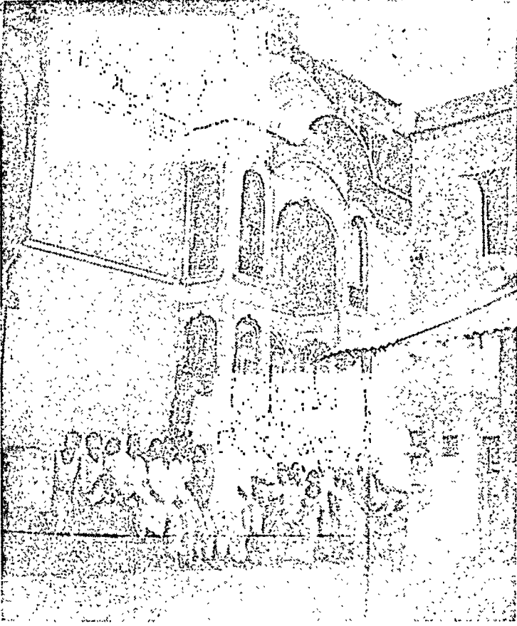
श्री नेमिनाथ दिगम्बर जैन मन्दिर कुकनवाली